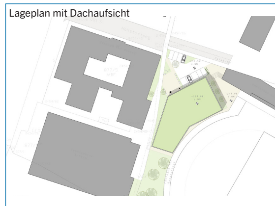
Konzeptstudie | Stand: April 2019

Durch großzügige, modern eingerichtete Umkleekabinen und einem Saunabereich wird der Besuch in unserem SPORTVEREINSZENTRUMS im Herzen von Künzelsau ein besonderes Erlebnis.